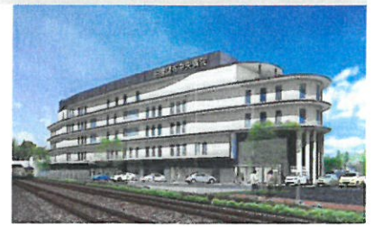
田園調布中央病院 新築移転計画進行中!